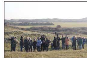
Een excursie van de Vogelwerkgroep op de noordpunt van Texel.

Om een vogel toch als individu te herkennen worden er al meer dan 100 jaar overal ter wereld vogels geticht; ze krijgen aan hun poos een metalen ring waarop het land van de ringplaats en een unieke cijfercombinatie staan vermeld, te vergelijken met ons BurgerService-Nummer. Mocht iemand een geringde vogel vinden, dan weten we van deze vogel direct al heel wat meer. We weten de afstand tussen de plek waar de vogel is geringd en waar hij is teruggevonden, we weten hoe oud de vogel is geworden (als het als een reusling is geringd) en soms weten we dan ook de doodsoorzaak (kat, verkeerslachtoffer, tegen een ruit aangelopen). Als we nu deze gegevens van honderdduizenden vogels combineren dan komen we over een soort veel te weten: waar broeden deze vogels, waar overwinteren ze en hoe oud kunnen ze worden. Hierdoor zijn we weten gekomen dat de Waddenzee een belangrijke transitiezone is tussen de overwinteringsgebieden in West-Afrika en de broedgebieden in Siberië. Tegenwoordig gaan vogelaars steeds vaker met kijkers en/of telescopen