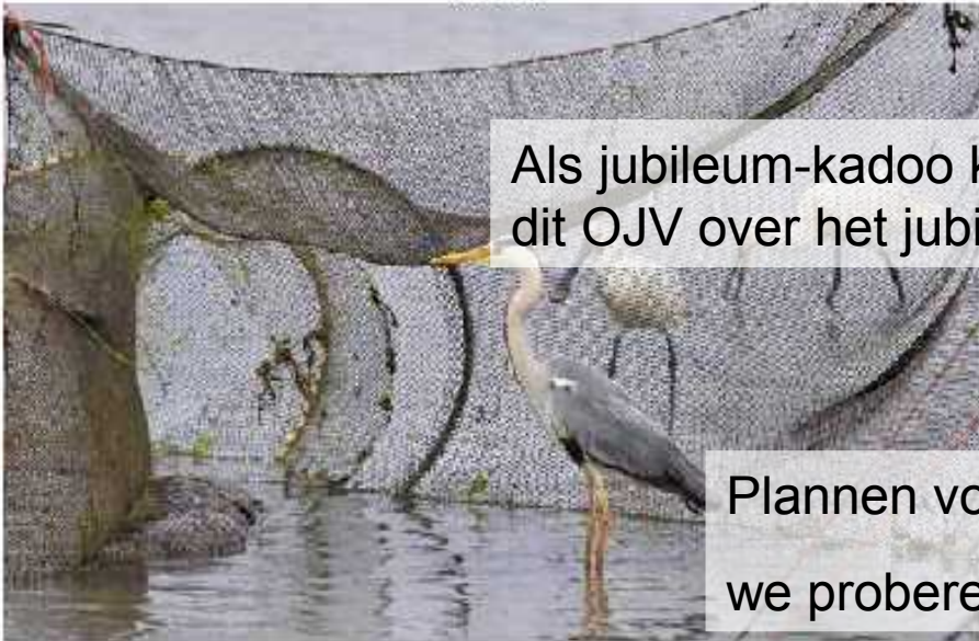
Blauwe Reiger Ardea cinerea , ad, op achtergrond Lepelaar Platalea leucorodia , 2 ad, Krassekeet, 20 mei 2012

Als jubileum-kadoo krijgen alle leden dit OJV over het jubileumjaar gratis