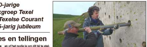
Met spullen van de gaten in de overzeeskwad in het Minkswaai.

Mede door de toenemende recreatiedruk kwamen de strandbroeders in de problemen. Vooral op de brede stranden van de Hors en de Voorland namen de aantallen dwergstems, bombleplevieren en strandplevieren snel af. In goed