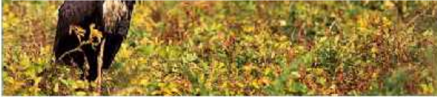
Zwarte Ooievaar Actonis nigra , juv, Prins Hendrikpolder, 29 augustus 2012

Eind maart is OJV 2012 verschenen: 72 pagina's 45 kleurenfoto's, 38 tabellen, 10 grafieken en 10 verspreidingskaartjes